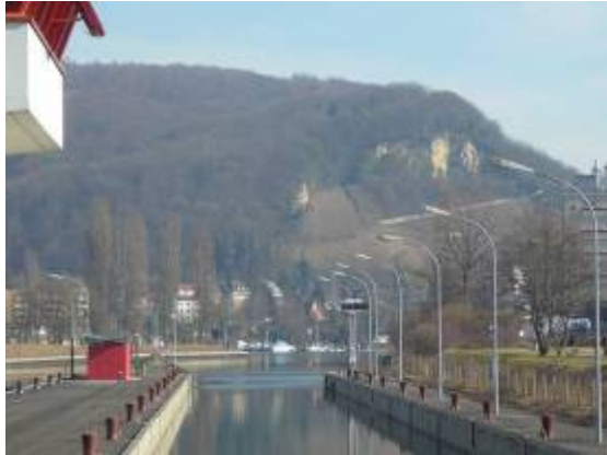
Birsfelder Schleuse - und Hornfelsen

Restaurant : Waldrain auf St. Chrischona, Montag und Dienstag Ruhetag http://www.vch.ch/restaurant-waldrain-basel.php / 061 601 60 22