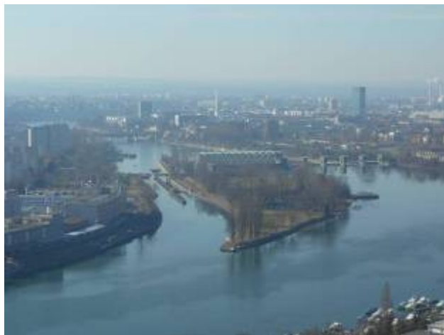
Blick vom Hornfelsen aufs Kraftwerksinseli und Basel